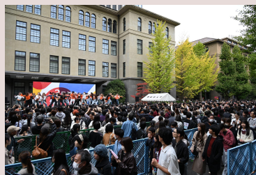
早稲田 キャンパス